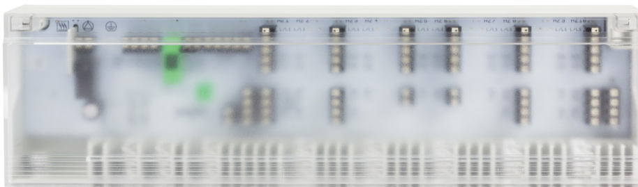
6 - ZONES

Vloerverwarming is een traag proces: wijzigingen in instellingen zijn niet meteen voelbaar. Temperatuur is een gevoelskwestie: laat u niet teveel leiden door exacte waardes, een temperatuur kan nooit constant zijn. Bijvoorbeeld, bij moderne goed geïsoleerde woningen is maar weinig capaciteit nodig om de temperatuur in de ruimte te beïnvloeden. Ook ventilatieroosters, personen, verlichting en apparatuur hebben invloed op de temperatuur. Openstaande deuren horen daar ook bij.